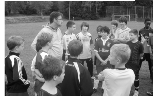
Ansprache vom Trainer