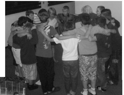
Der Vereinsspruch wird geübt