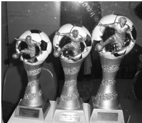
Die Belohnungen für siegreiche Mannschaften