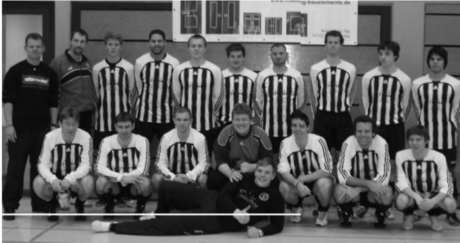
Die Turnierleitung unserer 3.

Die 3. Herrenmannschaft richtete am Sonntag, 5. Februar, erfolgreich ihr Hallenturnier in der TU-Halle aus.