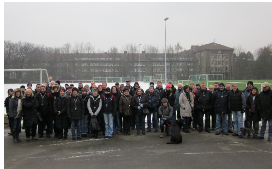
Braunkohlwanderung am letzten Januarsamstag mit 60 Teilnehmern und einigen Vierbeinern - vom Franzschen Feld bis nach Weddel und zurück

FEBRUAR 2012 / JAHRGANG 29 / AUSGABE 333