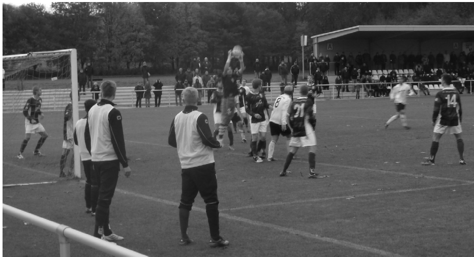
Volle Hütte beim Derby unserer 1. Herrenmannschaft gegen Freie Turner